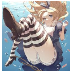
フブキ『水中アリス』