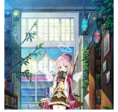
夜ノみつき『森の司書』

クリエイターファースト。日本アニメ・コミック特化のプラットフォーム「ANIFTY」 https://anifty.jp/ja