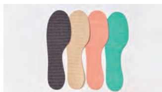
カラーを変えて毎日はき替え