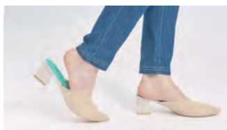
ミュールでもスレずに歩きやすい

「はかないくつした」は「靴下を足に履かない」という逆転の発想で、歩きやすく、汗を吸ってムレにくく、ずれにくい足元の快適性がアップする商品になります。パンプスやサンダル、ミュールにも使えて、素足で靴を履いても気持ちいいのが特徴です。