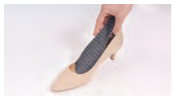
靴にはかせる逆転の発想