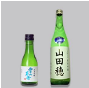
雪の茅舎 蔵元：齋彌酒造店

前回好評だった参加者の質問にお答えするコーナーや大抽選会も実施。太田さんファンはもちろんのこと、日本酒好きの方にも楽しんでいただけるイベントです。