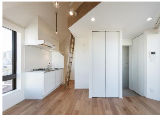
【物件内観】（物件写真は竣工時に撮影）