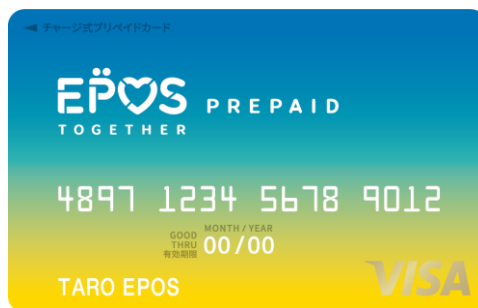
プリペイドカード