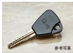
センサーにかざすだけで解錠できる ノンタッチキー