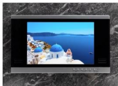
バスタイムをより楽しめる 浴室テレビ標準装備