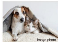
ペット可マンション ※ペットの種類・大きさ・ 頭数などに制限があります。