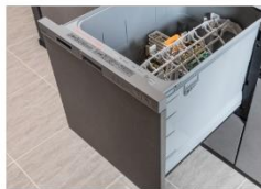
家事の負担を軽減する 食器洗い乾燥機