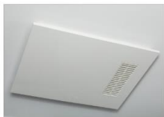
雨の日も洗濯物を乾かせる 浴室換気暖房乾燥機