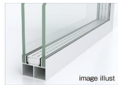
断熱性の高い Low-E複層ガラス ※一部除く