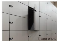
外出時にも便利な 宅配ボックス