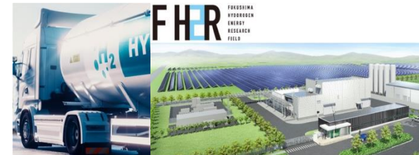
出典：新エネルギー・産業技術総合開発機構（NEDO） ニュースリリース（2018年8月9日）

水素サプライチェーンや利活用分野の開発・実用化の過程で求められる高圧圧縮ニーズをタイムリーに把握し、それに基づく製品開発を推進し、先行して市場投入を図る。