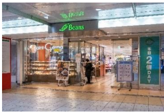
ビーンズ西川口 (徒歩3分/約210m)