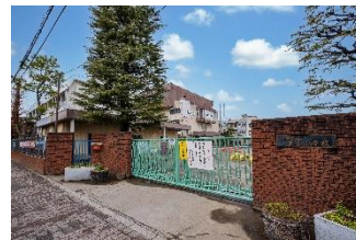
並木小学校 (徒歩7分/約560m)