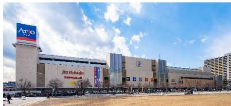
アリオ川口 (徒歩12分/約960m)