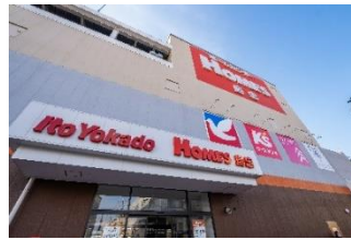
イトヨーカドー西川口店 (徒歩7分/約490m)