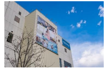
ダンロップスポーツクラブ川口店 (徒歩16分/約1,220m)