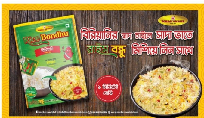
ユーグレナ入りふりかけ「Rice Bondhu（ライス ボンドゥ）」