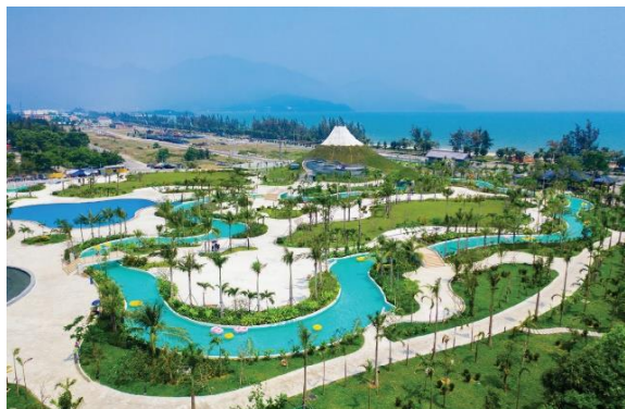
【ベトナム最大の富士山モデル】