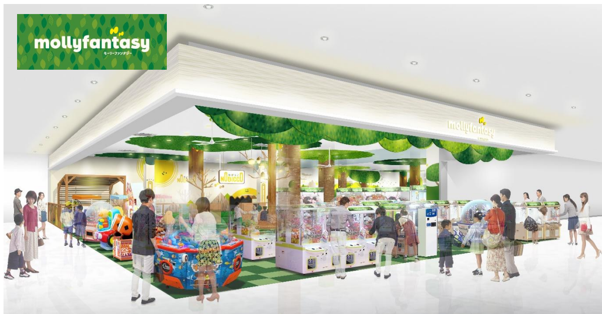
モーリーファンタジー イメージ

ファミリーで安心して楽しめるアミューズメント施設「モーリーファンタジー」は国内・海外で590店舗以上を展開し、その世界観は世界中の子どもたちとファミリーに愛されています。「モーリーファンタジー ニトリモール枚方店」は、「あそびごろの森」をコンセプトとし、明るい店内にファミリーで楽しめるアーケードゲーム機や人気のプライズゲーム機を取りそろえています。また、大阪府で初めて0～3歳児向けプレイグラウンド「のびっこ」を併設し、多彩なあそびをお届けします。