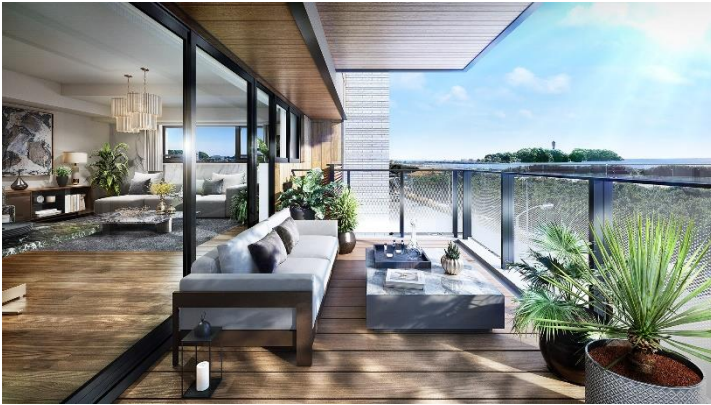
バルコニー完成予想図 (Kタイプ) (※11)