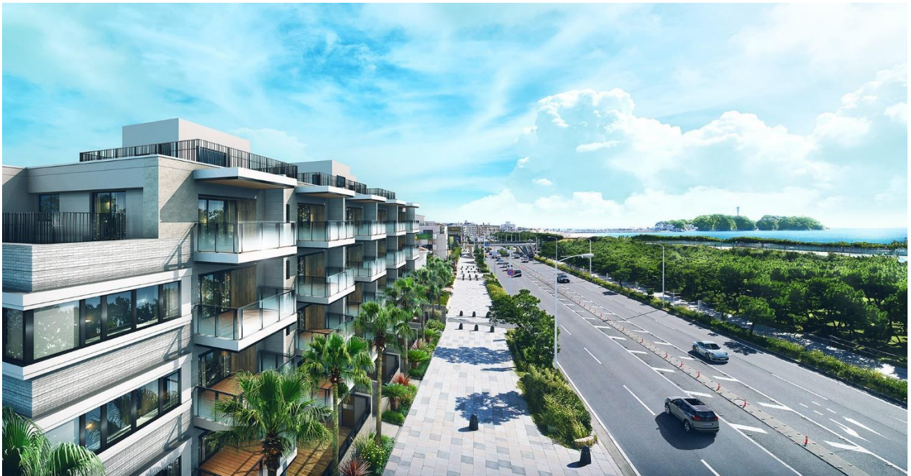
借景外観完成予想図（※1）

住戸プランは、55.98㎡～167.72㎡（1LDK～3LDK）で、アウトドアリビングとしても利用できる最大奥行約3.0m（※4）のバルコニーを設置しました。最上階には、屋上テラスを備えた100㎡超のプレミアムプランを3戸の、海を最前席とする贅沢なプライベート空間を愉しめる住まいをご提案しています。