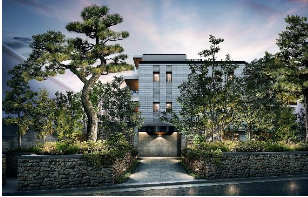
タウンエントランスアプローチ完成予想図 (※2)