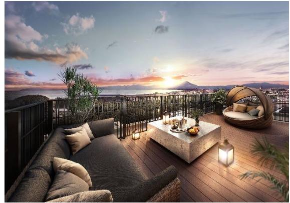
屋上テラス完成予想図 (Iタイプ) (※12)