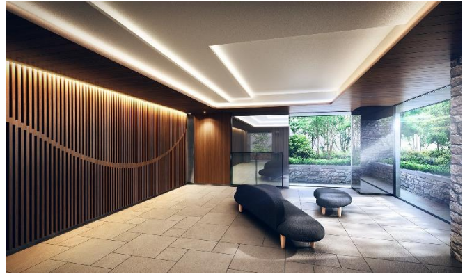
タウンエントランスホール完成予想図 (※3)