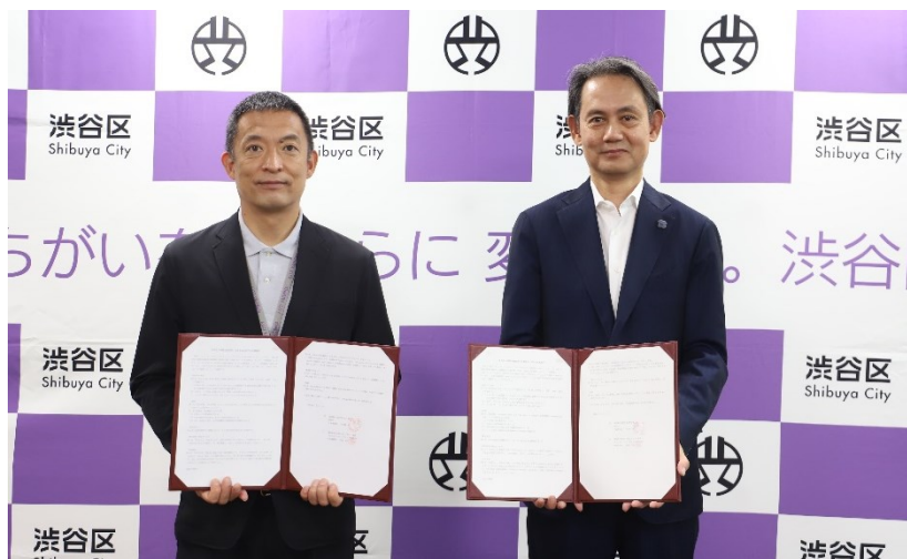
6/23 東京都渋谷区との協定

渋谷区との協定締結は全国で 573 例目、東京都 23 区内では 18 例目となります。