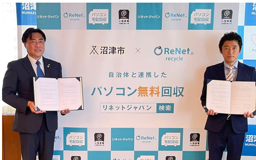
6/29 静岡県沼津市との協定式

6月29日に沼津市の頼重市長と協定式を実施しました。沼津市との協定締結は全国で574例目、静岡県内では16例目となります。