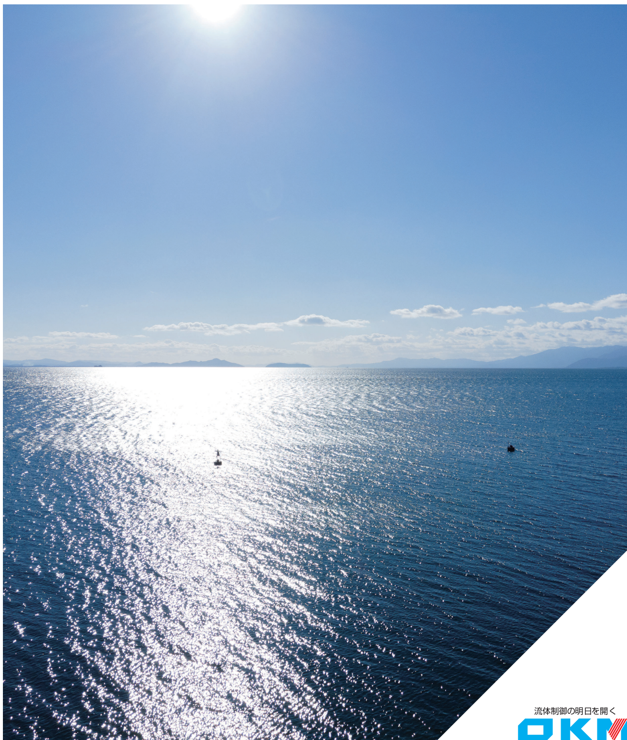
東岸の上空より望む琵琶湖