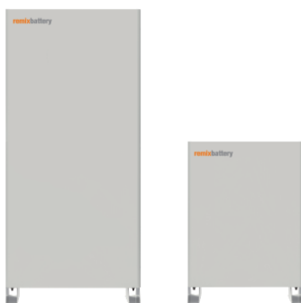
蓄電池容量 11.5kWh 蓄電システム本体+増設蓄電池