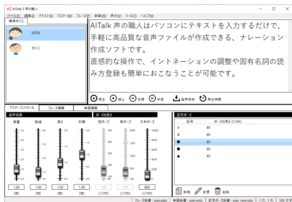
(旧) AITalk5 声の職人 製品画面