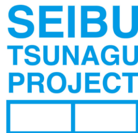
プロジェクトロゴ

今後、思いを持った人同士が“つながり”その思いをかたちにする場を作り、また地域の一員として“つながり”まちを魅力的にするサービスを生み出してまいります。