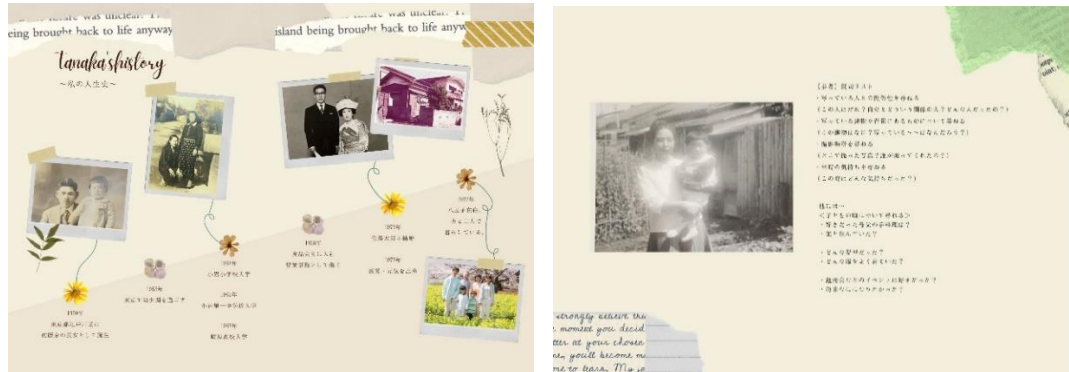
(左)年代ごとに人生を振り返るページ (右)回想法を使ったインタビューで、思い出をまとめるページ

基本的には、用意されたテンプレートに沿って、写真と文字を入力していただくだけで、だれでも簡単に作成いただけます。Canvaにはたくさんのテンプレートや素材がそろっているので、もちろんオリジナルにアレンジしていただくことも可能です。