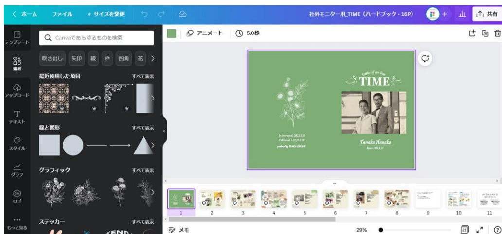
直感的に編集できるCanva操作画面