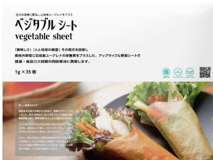
「ベジタブルシート」商品イメージ

※1 本来であれば廃棄されていた食材や食料を活用し、付加価値をつけて新たな商品とすること