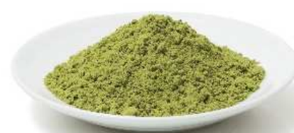
石垣島ユーグレナ粉末

ユーグレナは藻の仲間です。豊かな石垣島の自然で育った石垣島ユーグレナは、人間が必要とする豊富な栄養素（ビタミン、ミネラル、アミノ酸、DHA、オレイン酸などの不飽和脂肪酸、特有成分パラミロン※2など）を持ち、細胞壁をもたないため、栄養の消化吸収率も高い特長があるスーパーフードです。また、環境的要素に配慮した責任ある方法で育てられていることが認められ、