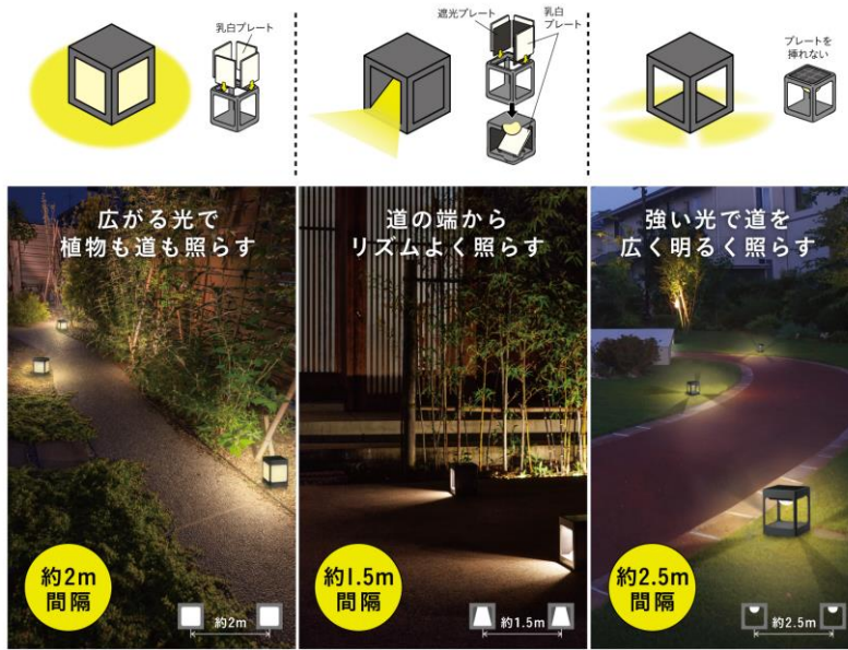
【SUNCHARGE 『道のひかり』 使用イメージ】