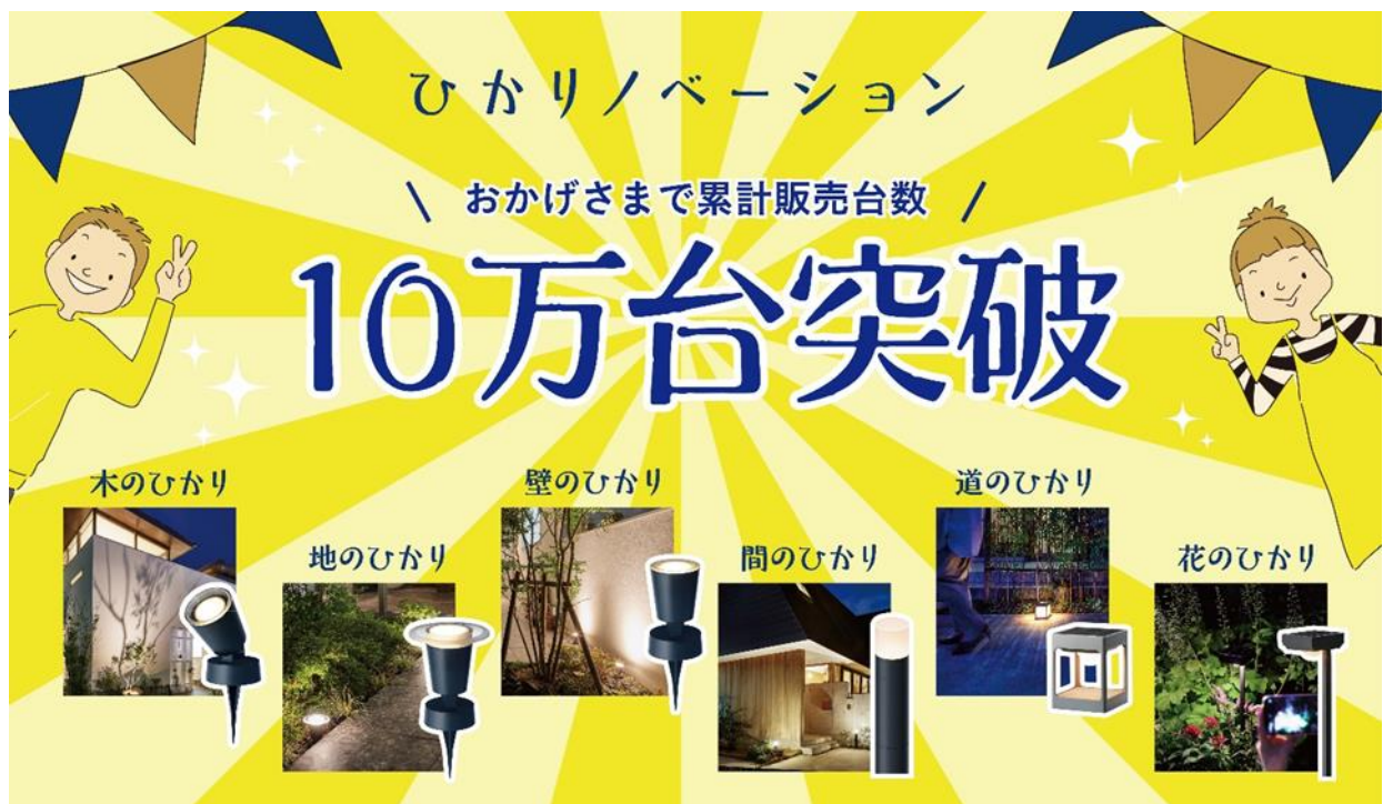
【『ひかりノベーション』シリーズ イメージ】

公式 WEB サイト： https://www.hikarenovation.com/