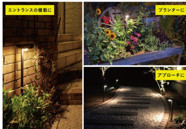
【SUNCHARGE 『花のひかり』 使用イメージ】