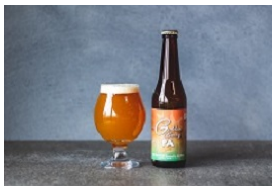
「GOLDEN BERRY ペールエール」

「フランチャイズ事業」では、自社試験圃場での栽培実績をもとに、自社独自の特許農法（多段式ポット）とICTシステムの提供に加えて、お客様の要望に沿った多種多様な農法・システム・農業関連製品の提供を行う農業総合コンサルティングサービスを展開しております。2022年3月には岩手県のローカルテレビ局テレビ岩手の「5きげんテレビ」にてスマート農業を活用したゴールデンベリーの栽培の様子並びに各商品の取材を受けております。