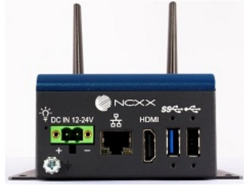
NCXX AI BOX 「AIX-01NX」