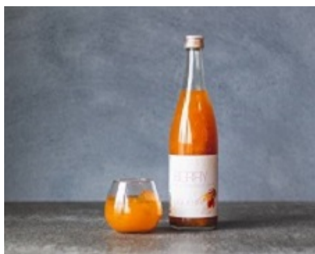
「GOLDEN BERRY フレッシュリキュール」

「6次産業化事業」では、引き続きスーパーフードとして人気の高いGOLDEN BERRY（食用ほおずき）の生産、販売を行っており、岩手県内では花巻市内のファミリーマート全店で青果と加工品のGOLDEN BERRYアイスが取り扱われております。また、2021年12月には酒類販売業免許を取得し、新商品「GOLDEN BERRY フレッシュリキュール」の販売を開始しております。2022年4月には宮城県河北新報社が発行している情報誌「河北ウィークリーせんだい」の東北お取り寄せ情報欄にそのゴールデンベリーリキュールが掲載されております。