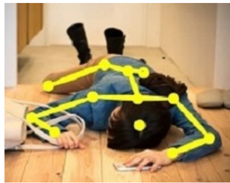
転倒などの異常検知

また、データ通信端末につきましては、第5世代移动通信システムである5Gに対応した製品の開発を開始しており、2022年後半の販売を予定しております。5Gは、LTEと比べて超高速・大容量な通信で多数同時接続、超低遅を実現するもので、今後、日本全国に基地局の展開が計画されており、ライブメディアストリーミング、エクステンデットリアリティ（XR）、遠隔医療、建設現場の建機遠隔制御、工場のスマートファクトリ、農業を高度化する自動農場管理、自治体の河川等の監視などの建物内や敷地内でスポット的に柔軟に構築できるローカル5Gへの活用など、地域課題解決や地方創生への対象領域の拡大が期待されます。