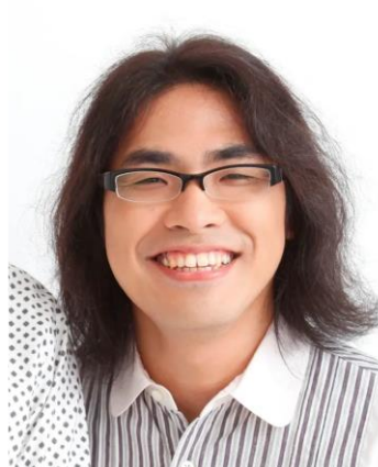
【スペシャルゲスト】 ロッチ 中岡創一さん