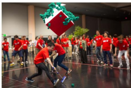
イメージ画像：Cube on Cube

また、マジックテープ®を使った自社開発の新しい競技「Cube on Cube」、パーツやホッケーをモチーフにした撮影スポット「Field Canvas パーツ de アート」や海洋漂着プラスチックごみ問題の解決に向けたモリトの取り組みを紹介する「SDGs クイズコーナー」なども準備。ホッケーとパーツを1日で楽しめるイベントを予定しています。