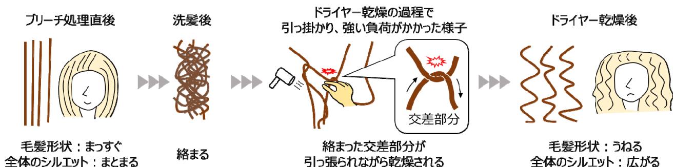
図1 ブリーチ毛髪がドライヤー乾燥の過程で広がる様子

ブリーチ毛髪で洗髪時に生じた絡まりは、そのままでは洗髪後のタオルドライを経ても残ってしまいます。本研究によって、絡まったブリーチ毛髪をドライヤーで乾燥させる過程で引っ掛かって強い負荷がかかると、絡まった交差部分が引っ張られながら乾燥されて、うねりが発生することが確認されました(図1)。図1に示す通り、毛髪一本一本の形状がうねると、全体のシルエットとしては広がりまとまりにくくなります。