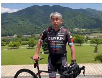
JCL チェアマン 片山右京