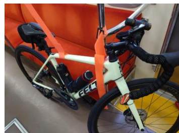
車両への固定方(イメージ)