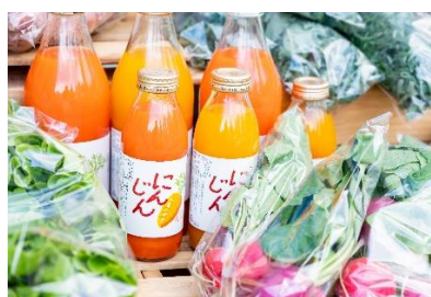
西武グリーンマルシェ ポップアップ店舗イメージ