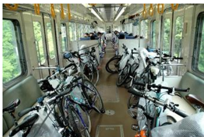
サイクルトレインイメージ