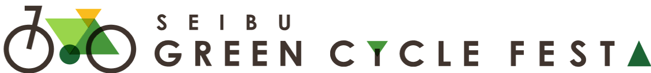
「西武グリーンサイクルフェスタ」ロゴ