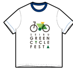
スタッフTシャツイメージ