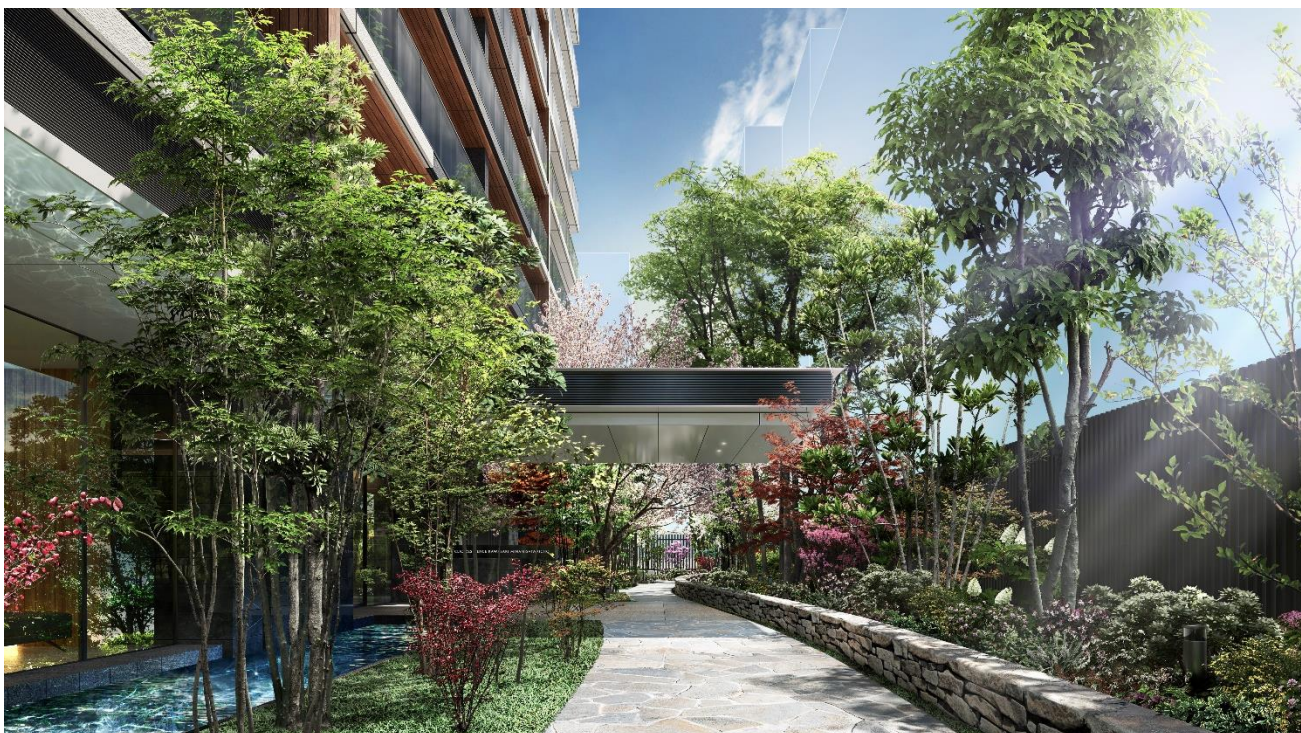
エントランスアプローチ完成予想図（※1）