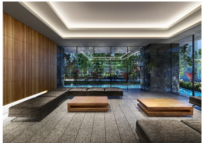
エントランスホール完成予想図（※1）