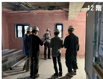
12階：ユニットバス組立工事