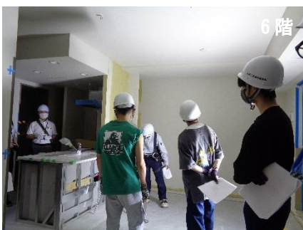
6階：内装工事（壁・天井クロス貼り）