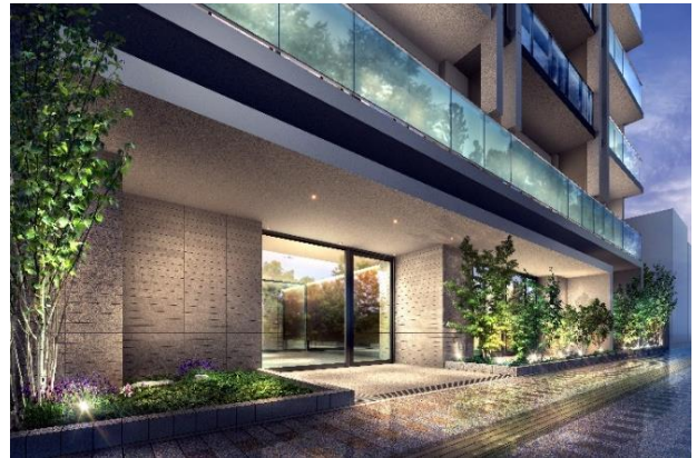
エントランス完成予想図（※2）