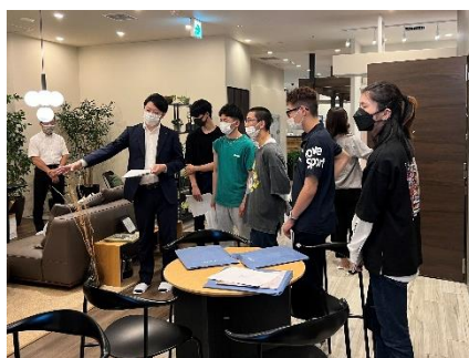
クリオ ライフスタイルサロン札幌 コンセプトルーム案内