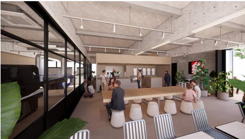
イメージ：左手にAtlas MAX。テクノロジー×みんなのアイデアで、次世代のアパレル産業が生まれる場所へ

まずは今秋、神宮前にプリント工房とカフェが融合した新拠点「CREATIVE PLAZA HATTO(クリエイティブプラザハット)」をオープンします。HATTOの目玉は、日本初導入となる、Atlas MAXです。Atlas MAXでは小ロットから、仕立て済みの服に、クオリティ高い立体プリントや、糸を使わない刺繍風プリントをすることが可能です。また、カフェや展示スペースも併設し、アパレル関係者のみなさまがAtlas MAXを使って試作品をつくったり、コーヒーを飲みながらアイデアを交換したり、ポップアップショップや展示会を開ける場所にします。最新テクノロジーのAtlas MAXと、人々が交り合うリアルな場の融合を通じ、業界全体でサステナブルなファッションへの解を見つけていくことを目指します。