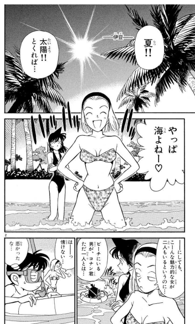
▲「三つ子別荘殺人事件」コミック場面写