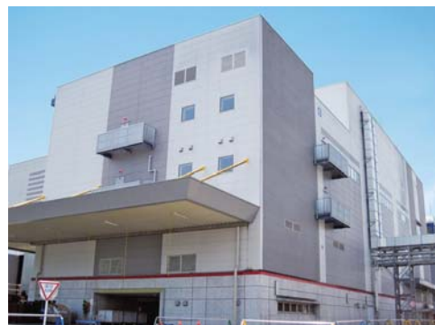
新規設備を導入する吾妻工場の既存工棟

当社では今後も引き続き、半導体メーカー各社の増産投資や技術革新への対応を図るべく、エレクトロニクス関連市場に向けた積極的な新製品開発と高品質製品の安定供給を継続的に推進していきけるよう、体制面の強化を図っていく考えです。