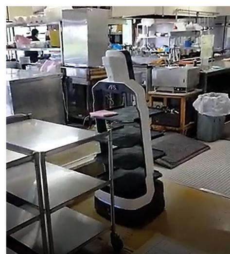
写真：ゴルフ場でのa8号機の様子