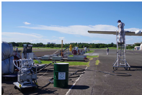
給油の様子（石野礦油株式会社による給油）

アジア航測は、これまで自社保有の機体で2度のユーグレナ社が供給する SAF 利用飛行を実施し（2022年3月17日、6月23日）、SAF 利用に関する燃料管理や給油、点検等における作業手順や安全管理に関するオペレーションを確認してきました。今回のフライトは、アジア航測の受託業務においても初の SAF 利用で、岩手県遠野市の「森林資源計測業務」の一環として、同市のご理解とご協力を得て実現したものです。