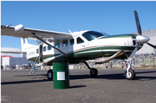
アジア航測保有の JA12AJ

アジア航測株式会社（本社：東京都新宿区、代表取締役社長 畠山仁、以下「アジア航測」）と株式会社ユーグレナ（本社：東京都港区、代表取締役社長：出雲充、以下「ユーグレナ社」）は、ユーグレナ社の製造・販売するバイオジェット燃料（以下「SAF」）「サステオ」 ※1 を使用して、2022年7月31日に3度目のフライトを行いました。SAF燃料でのフライトは、東京都の運営する調布飛行場では今回が初の取り組みとなります。