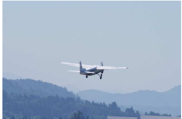
SAFを使用したフライト