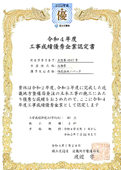
国土交通省 近畿地方整備局