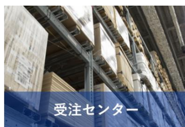
メーカー：FAXによる注文受付