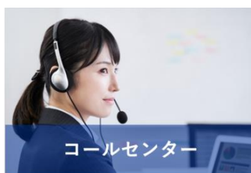
保険：申込書による新規加入受付及びサポート