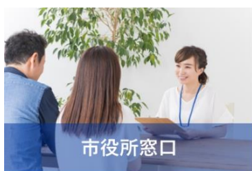
地方自治体：申請書による給付金申請受付