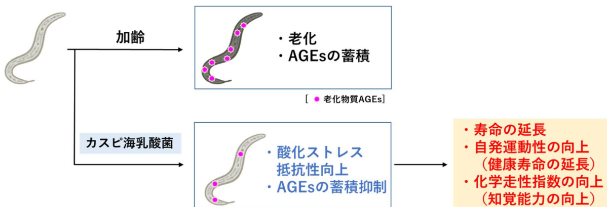
図 2. 「カスピ海乳酸菌」による線虫の寿命延長メカニズム