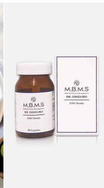
健康食品及び サプリメント