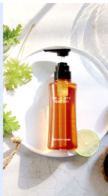
me_more MARUKO シリーズ