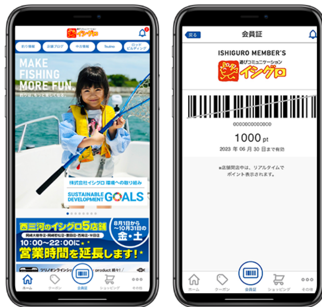
図1 『釣具のイシグロ メンバーズアプリ』アイコンとトップ/会員証画面