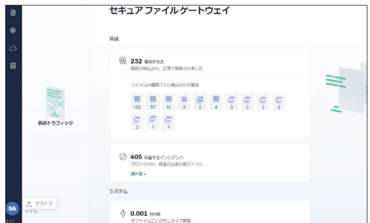
VOTIRO Secure File Gateway 管理画面 ※3

なお VOTIRO Secure File Gateway の販売開始は 8 月 23 日から、販売価格はオープンプライス（参考価格：1 ユーザ 12,000 円/年 ※4 ）、初年度 1 億円の販売を目指します。