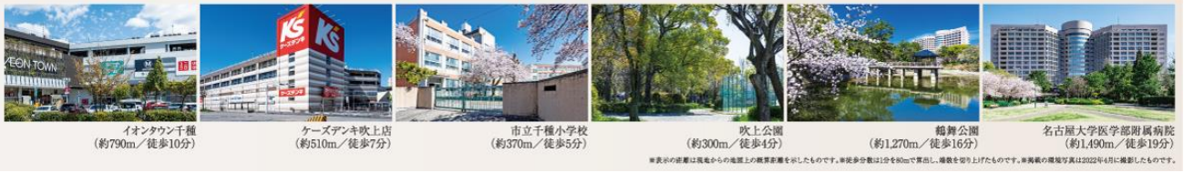
※表示の距離は現在地からの直線距離を示したものです。※徒歩歩数は1分を80mで算出し、繰上りを切り上げたものです。※掲載の掲載写真は2022年4月に撮影したものです。

スーパーマーケットはもちろん、カフェ、書店、ファッション、グルメなどの多彩なショップが並ぶイオンタウン千種へ徒歩10分。吹上公園や鶴舞公園、教育施設や医療機関も身近で、都心を間近にしながら、落ち着きと充実した暮らしの豊かさを享受できる環境が広がっています。