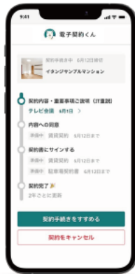
「電子契約くん」入居者 利用画面イメージ