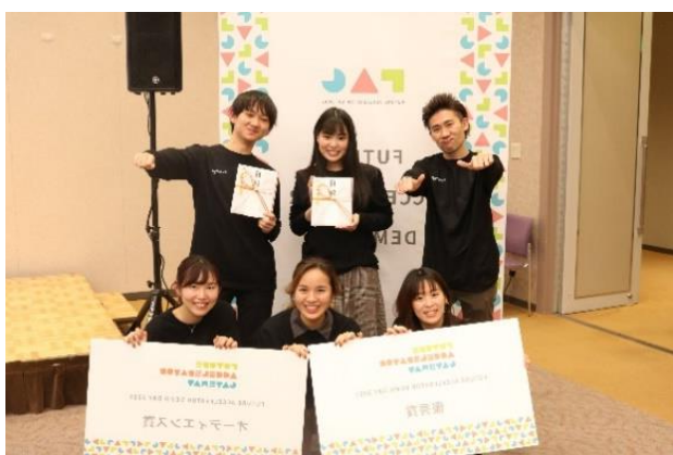
スーパーマリリンブラザーズ

※第1回の様子： https://www.0101maruigroup.co.jp/future/archive/001.html