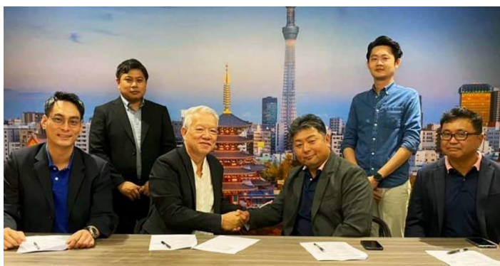
■マレーシアでの契約締結の様子

DBM 社はこれまで、国際ハブであるシンガポールに近い地の利を持つジョホールバルに拠点を置いておりますが、本提携により、多くの日系企業が集まるビジネス街の中心地であるマレーシアの首都クアラルンプール圏でも管理業務拡大を目指し、G7 社単体でのマーケティングに加えて、DBM 社のネットワークによりクアラルンプールでの日系クライアント、ローカルクライアント、グローバルクライアントへからの管理獲得を目指し、マレーシアで急速に伸長する建物管理事業への対応力を一層強化していきます。