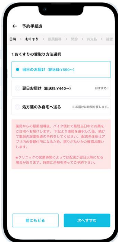
お薬の受け取り方法及び 薬局選択画面