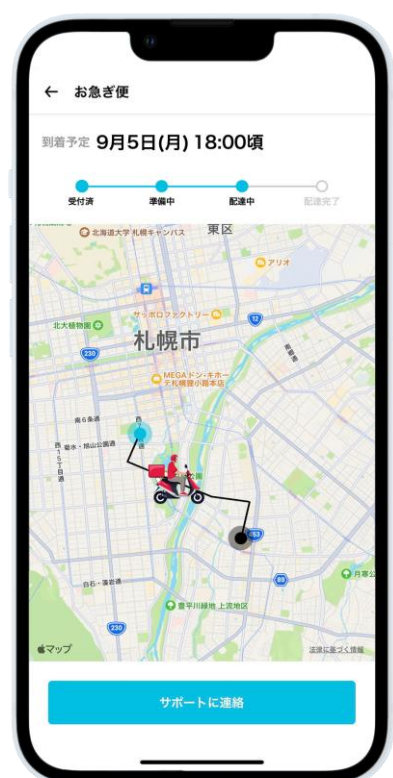
お急ぎ便お届け状況確認画面

今後も、「SOKUYAKU」では、処方薬当日配送可能エリアのさらなる拡大に向けた取り組みを進めてまいります。