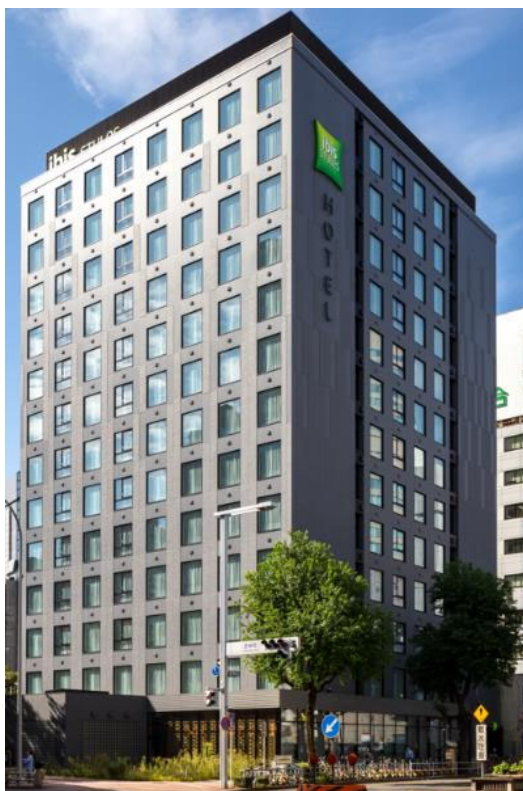
<イビスタイルズ名古屋 外観>

本制度の内容等は、評価協会運営サイト（ https://www.hyoukakyukai.or.jp/bels/info.html ）をご参照ください。