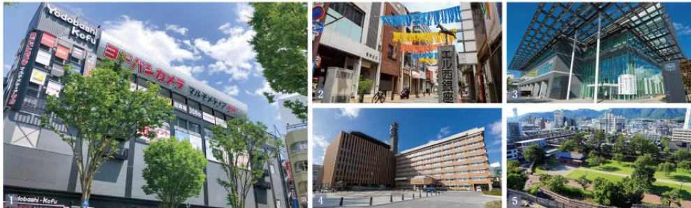
1.ドボツカメラ マルチメディア甲府 (徒歩9分/約720m) 2.エル西銀座商店街 (徒歩4分/約280m) 3.甲府市役所 (徒歩5分/約330m) 4.山梨県庁 (徒歩6分/約480m) 5.舞鶴城公園 (徒歩8分/約600m)