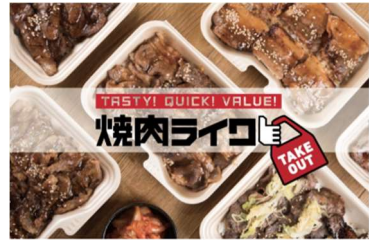
川口駅東口店【当社グループ 第8号店】（イメージ画像）