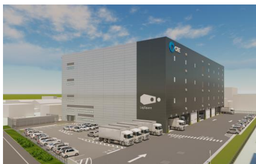
24 ロジスクエア厚木 I 2023年3月竣工予定