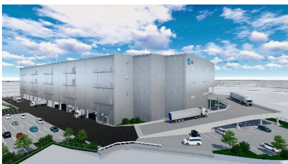
23 ロジスクエア枚方 2023年1月竣工予定