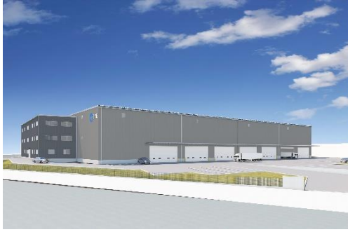
34 ロジスクエア掛川 2024年1月竣工予定