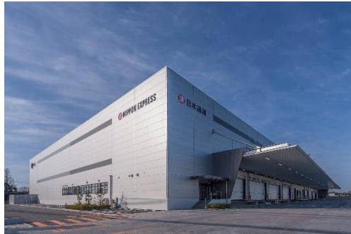
11 ロジスクエア鳥栖 2018年2月竣工