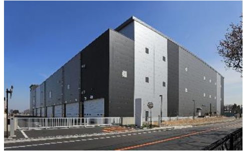
20 ロジスクエア三芳 II 2021年3月竣工