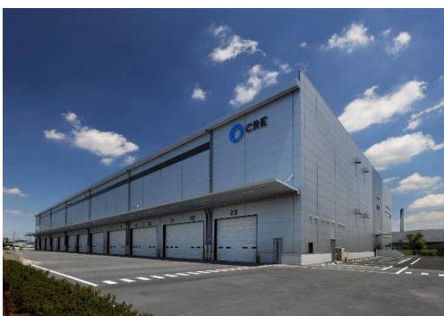
15 ロジスクエア川越Ⅱ 2019年6月竣工