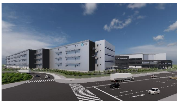
29 ロジスクエアふじみ野 A 2024年1月竣工予定