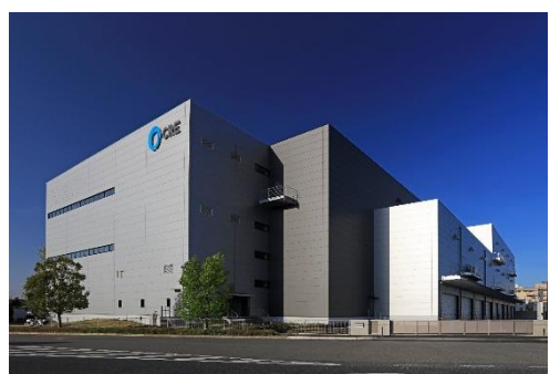
14 ロジスクエア上尾 2019年4月竣工