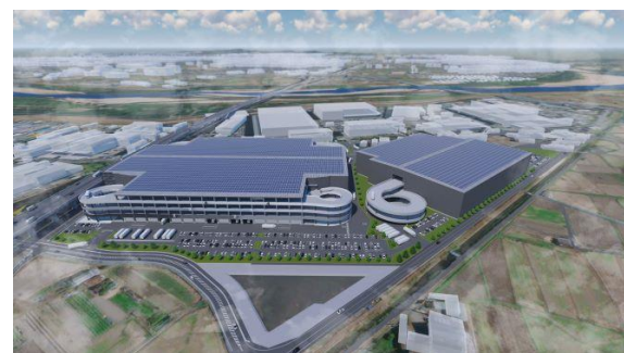
32 ロジスクエア京田辺 A 2025年2月竣工予定