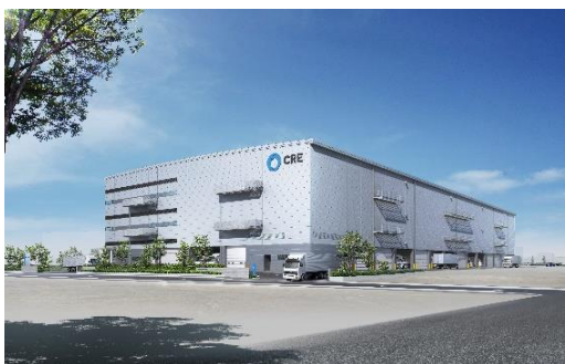
21 ロジスクエア伊丹 2022年11月竣工予定