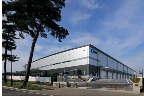
9 ロジスクエア守谷 2017年5月竣工