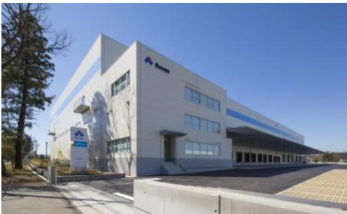
3 ロジスクエア日高 2015年3月竣工