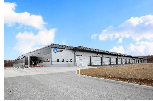
10 ロジスクエア千歳 2017年12月竣工