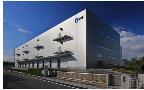
8 ロジスクエア新座 2017年4月竣工