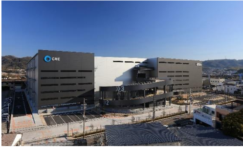
19 ロジスクエア大阪交野 2021年1月竣工