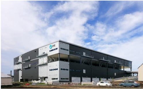
17 ロジスクエア三芳 2020年6月竣工