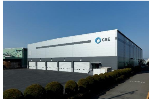
12 ロジスクエア川越 2018年2月竣工