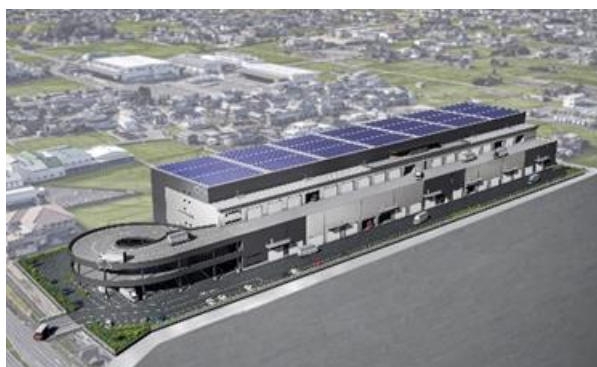
26 ロジスクエアアール宮 2023年9月竣工予定