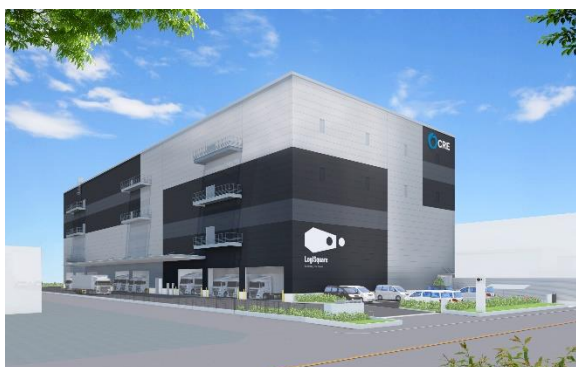
25 ロジスクエア松戸 2023年5月竣工予定