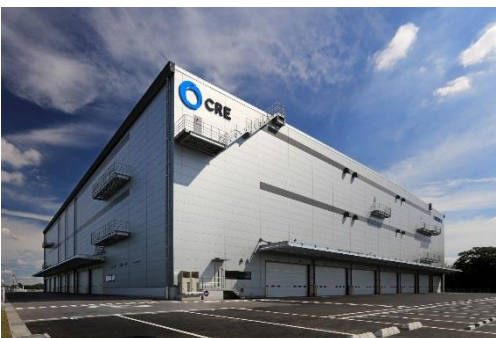
13 ロジスクエア春日部 2018年6月竣工