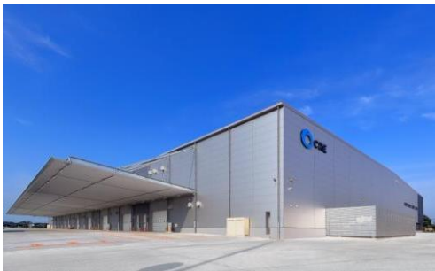
5 ロジスクエア羽生 2016年7月竣工