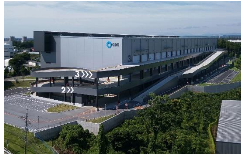
18 ロジスクエア狭山日高 2020年6月竣工