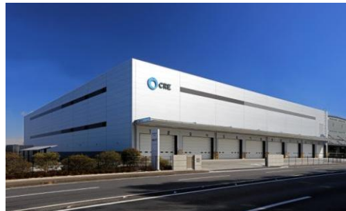
6 ロジスクエア久喜Ⅱ 2017年2月竣工