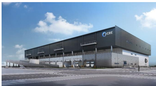
22 ロジスクエア白井 2022年12月竣工予定