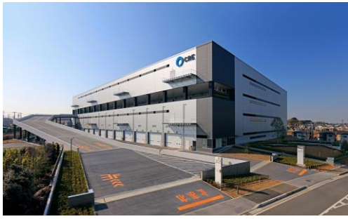
7 ロジスクエア浦和美園 2017年4月竣工