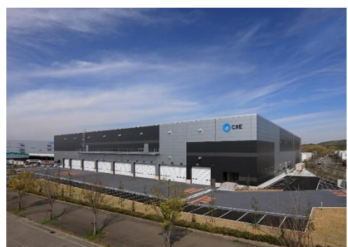
16 ロジスクエア神戸西 2020年4月竣工