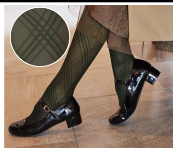
カラー: バイアスチェックカーキ