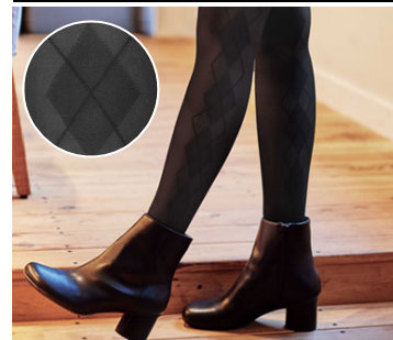
カラー: アーガイルブラック