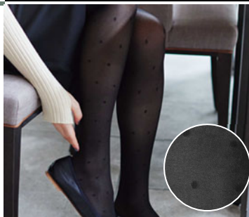
カラー: ドットブラック