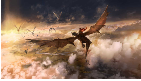
VR専用シューティングゲーム「ガンナーオブドラグーン」